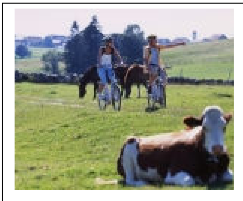
Pedeles by movelo